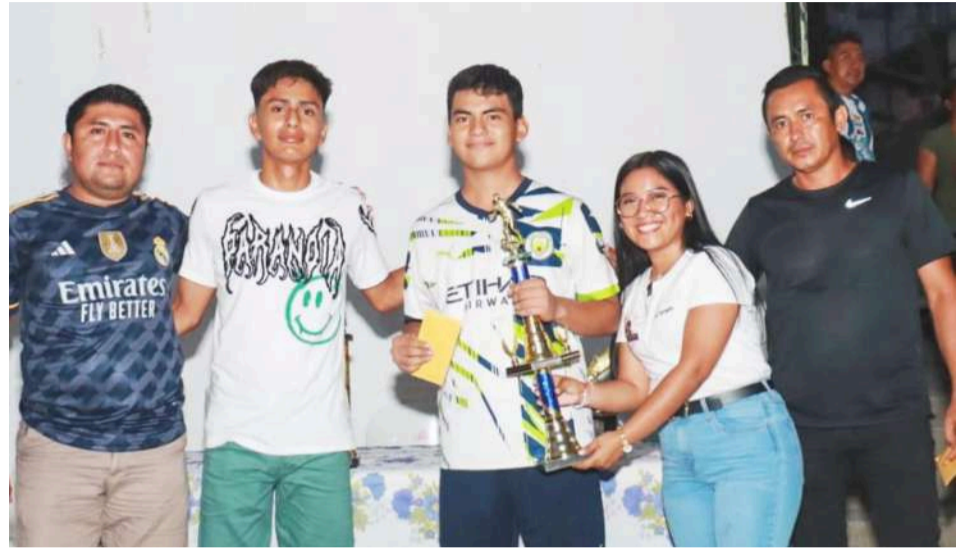
El capitán del subcampeón Troncos recibió el premio.