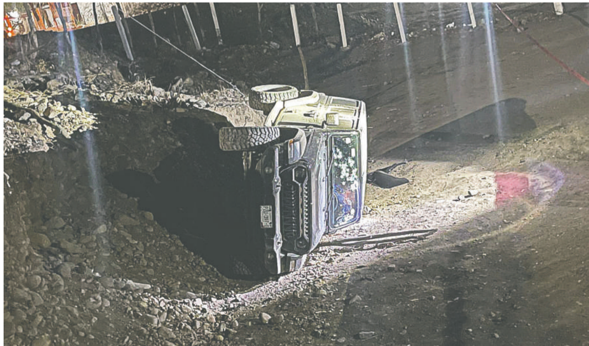
La camioneta del hoy occiso era perseguida por los asesinos.