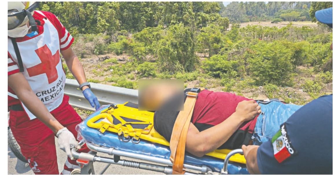
El marino fue rescatado de los fierros retorcidos de su vehículo.

Los voluntarios de la benemérita institución, tras rescatar de los fierros retor-