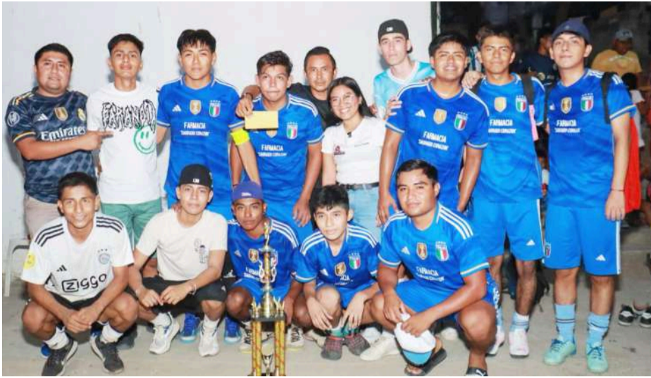
40 Grados logró ceñirse la corona de la categoría sub 19.