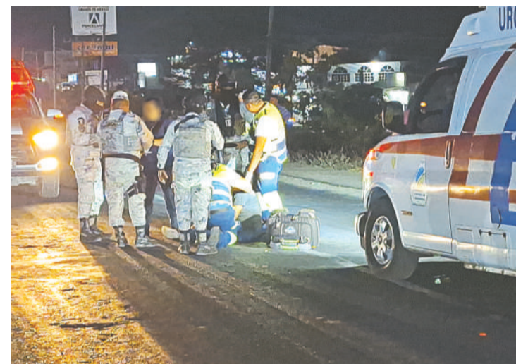
El motociclista lesionado recibió atención prehospitalaria de paramédicos de la CNE.