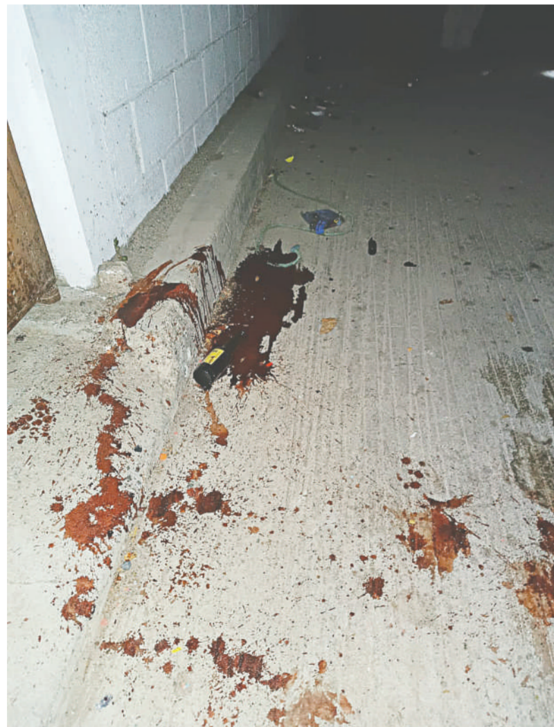
La policía sólo encontró manchas de sangre en el lugar.

Posteriormente al lugar arribaron los elementos de la Policía Municipal y Estatal Preventiva, quienes sólo encontraron man-