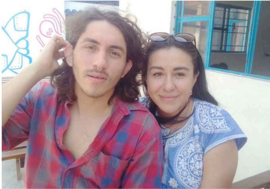
Realizan esfuerzos para lograr la integración de personas con autismo a la sociedad.

Se busca que un niño con autismo, pueda más adelante pueda continuar con un oficio, un tema de responsabilidad social que las empresas tienen que empezar a abrir espacios, pues en la región existen muchos niños con autismo.