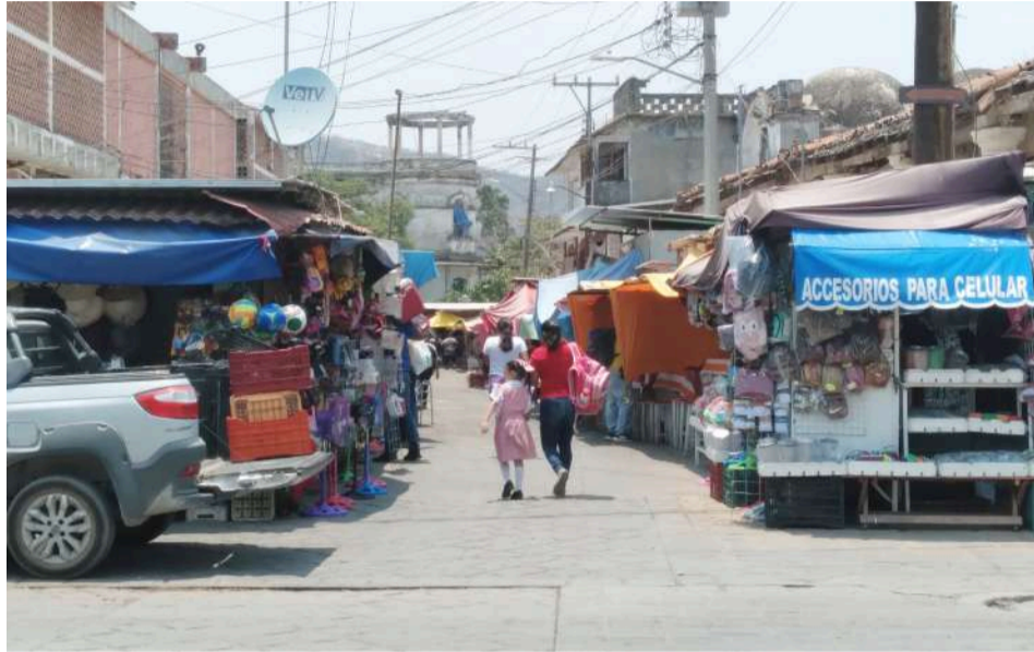
Ya comienza el movimiento por las celebraciones que se acercan.

El más cercano es el Día del Niño el próximo 30 de abril, y los comerciantes no dejan pasar la oportu-