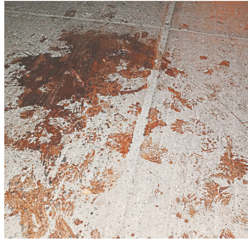
La fiesta de cumpleaños dejó cuatro lesionados con arma de fuego.