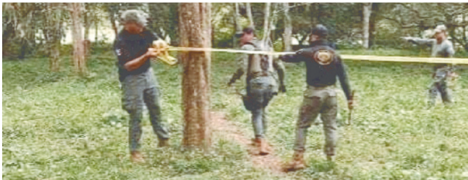
Imagen del predio en donde habrían sido encontrados los cuerpos.