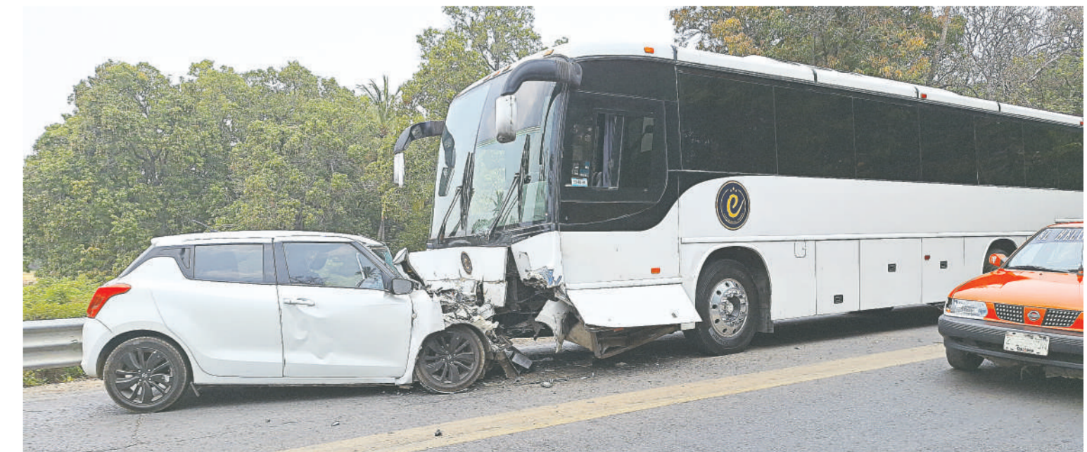
El conductor del automóvil invadió el carril contrario y chocó contra el autobús.

sentaron elementos de la Guardia Nacional, del Cuadrante Carretero, para deslindar responsabilidades y con el apoyo de dos grúas retiraron las unidades de motor siniestradas.