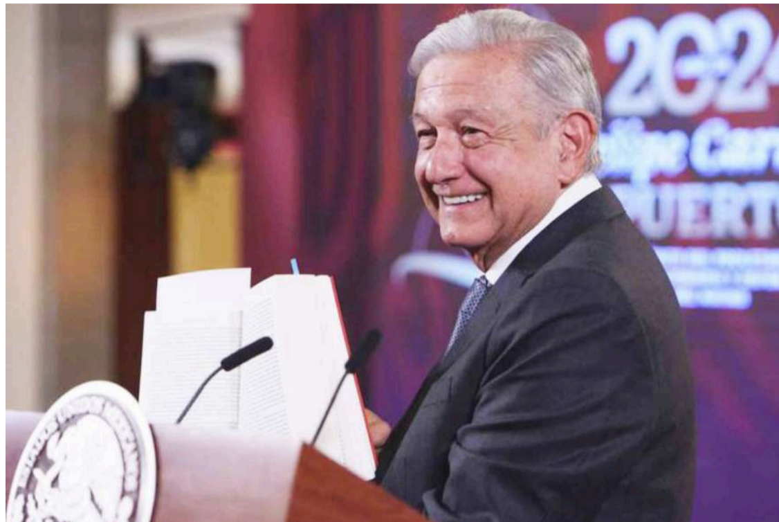
El presidente Andrés Manuel López Obrador celebró la aprobación del Fondo de Pensiones.

"Vamos a tratar este asunto el día 1 de mayo, que ese fue mi compromiso. Desde que