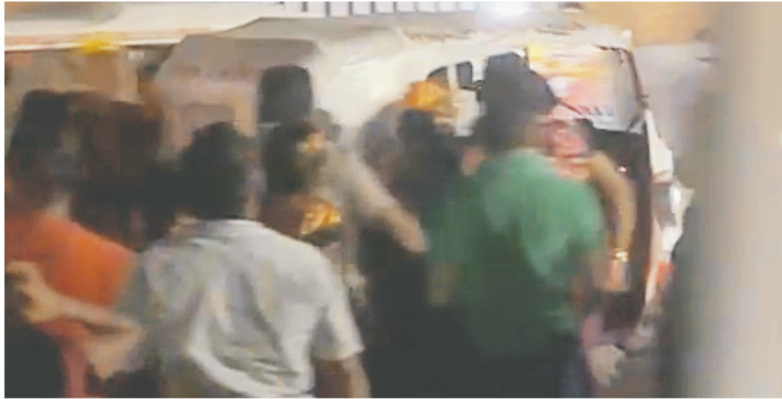
Familiares de los lesionados los trasladaron por sus propios medios al hospital general.