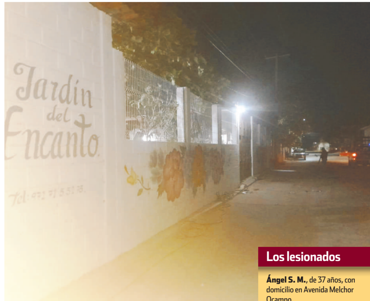
La fiesta se llevó a cabo en el salón Jardín del Encanto, ubicado en la Séptima Sección de Juchitán.

involucradas en esta riña habrían huido a bordo de una unidad de motor con rumbo desconocido, por lo que los elementos policiacos iniciaron la búsqueda de la unidad de motor tipo pickup de color negro.