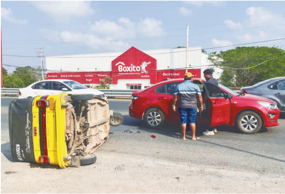
Los pasajeros del mototaxi resultaron lesionados, pero se retiraron del lugar.