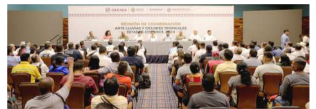
Debido a la presencia del fenómeno de La Niña, se esperan importantes precipitaciones en territorio mexicano.

Dijo que hasta el momento llevan un 60% de municipios con sus actas de consejos y se trabaja ya con las autoridades que aún no lo tienen, principalmente de la zona oriente.