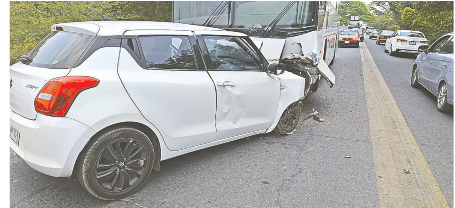
El aparatoso accidente se registró a la altura del Puente Pimentel.

Otra persona que resultó herida y no aportó datos, ya que fue llevado a un médico particular.