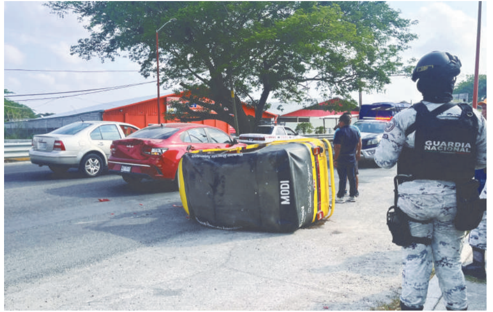
El mototaxi chocó contra el KIA y volcó; aseguran que el mototaxista se encontraba en estado de ebriedad.