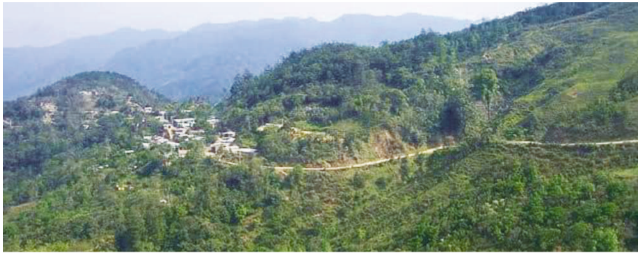
Están explotando la madera.

“Todos dicen que se trata de un helipuerto; que