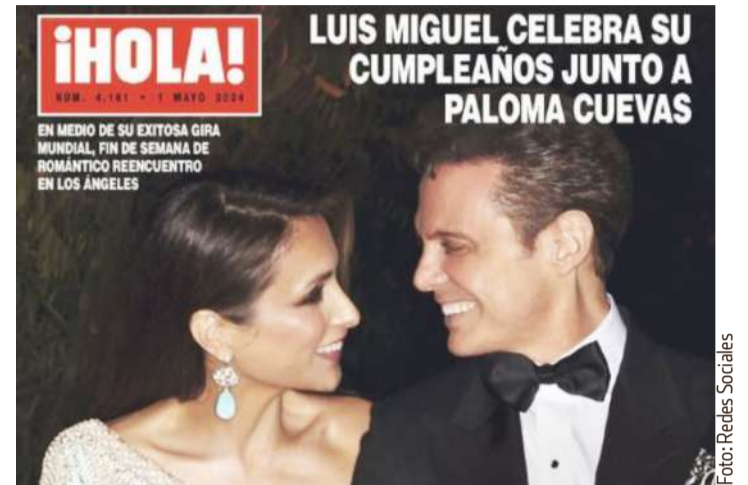
Luis Miguel y Paloma Cuevas protagonizan portada de revista más enamorados que nunca.

Pese al éxito que ha tenido en Estados Unidos, Derbez lamentó que no hay apoyo entre la comunidad latinoamericana en dicho país, ya que él ha invitado a varios compatriotas a sus proyectos, pero él no ha recibido el mismo trato, ni por sus colegas ni por otros directores o productores más importantes.