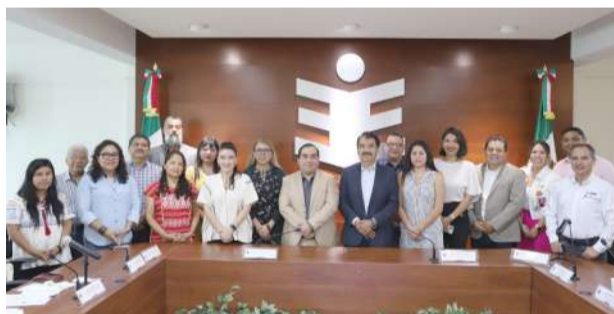
Consejo General realiza exhorto a Partidos Políticos para cumplir con paridad de género y acciones afirmativas

El IEEPCO es un órgano fortalecido y comprometido con los derechos políticos electorales de la ciudadanía oaxaqueña, además de ser una institución integrada por mu-